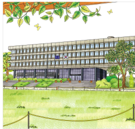
Administration Building(Headquarters), Campus Lawn

대학의 중심에 자리 잡은 행정관(본문)은 학교의 행정 업무를 총괄하여 중요성을 비롯하여 교무처, 학생처, 연구처, 기획처, 사주국, 시설관리국 등이 위치하고 있다. 행정관 앞 잔디광장에서는 페스티벌 공연과 학업박람회 등 비교적 큰 행사가 열린다.